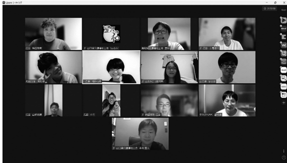
オンライン交流飲み会！

今年度は新しく3名の若手職員がNEXT委員に入り共に一年の活動を行ってきました。令和5年6月には広島県や島根県などの県外の若手職員とオンライン飲み会で交流を図り、本会開催の研修のお手伝い、令和6年1月26日には無事にNEXTの勉強会も行う事ができました。