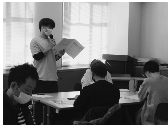
1/26勉強会を開催しました