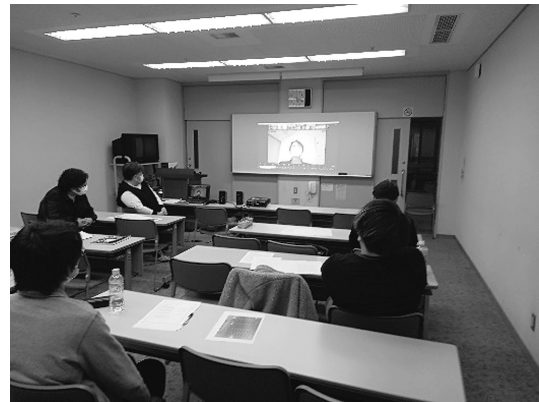
高知の理事は1つの会場に集まりました