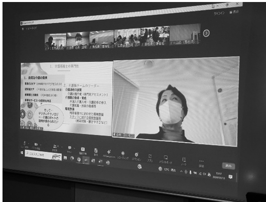
日本介護福祉士会及川会長は 島根県から参加しました

各県の介護福祉士会および、今回参加された皆さん、大変お疲れ様でした。ありがとうございました。