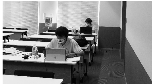
《オンラインでも交流》

研修の後半では座談会として、グループワークを行いました。毎年意見交換の場としてニーズの高い座談会ですが、やはりグループで話すと受講生の皆さんも積極的に発言され、一人一人の悩みや葛藤も共有することができました。全体の印象としては、悩みがある中でも誰もが楽しく仕事をするように考えて日々取り組まれているなあということです。また、「一緒に働く中で尊敬できる先輩がいる」「仕事を教えてもらえる」といった意見も多く、良い環境で成長することができることを改めて嬉しく思いました。