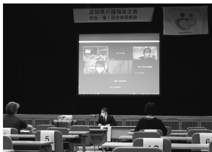
(総会もハイブリットで開催)

本年度、監事2名を含む15名の役員体制で、より良い会の運営を目指してまいります。