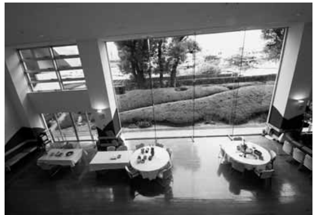
〈プレイルーム風景〉